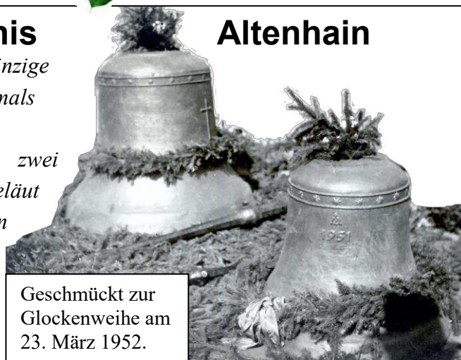
Geschmückt zur Glockenweihe am 23. März 1952.